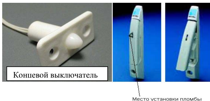
Рисунок 2. Места установки пломб и нанесения оттисков клейм от несанкционированного доступа на технические средства из состава ПТК