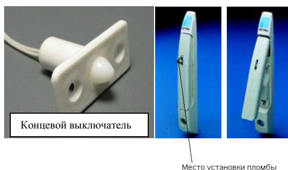
Рисунок 3 – Внешний вид датчика открытия дверцы

Дополнительная защита может быть предусмотрена путем закрепления контроллеров DevLink на DIN-рейку в корпусе шкафа, который закрывается на ключ или пломбируется. Также в шкаф может ставиться датчик открытия дверцы, информация с которого записывается в протокол событий контроллера, внешний вид датчика открытия дверцы приведен на рисунке 3.