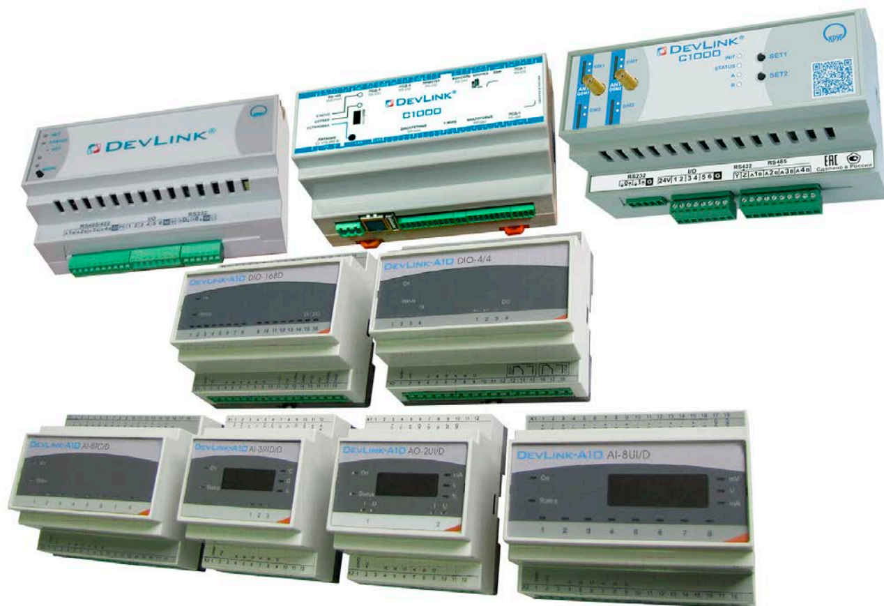
Рисунок 2 – Общий вид контроллеров DevLink

Для предотвращения несанкционированного доступа к контроллерам DevLink на его корпусе предусмотрен концевой выключатель. Принцип его действия состоит в том, что при вскрытии корпуса в протокол событий СРВК добавляется соответствующая запись.